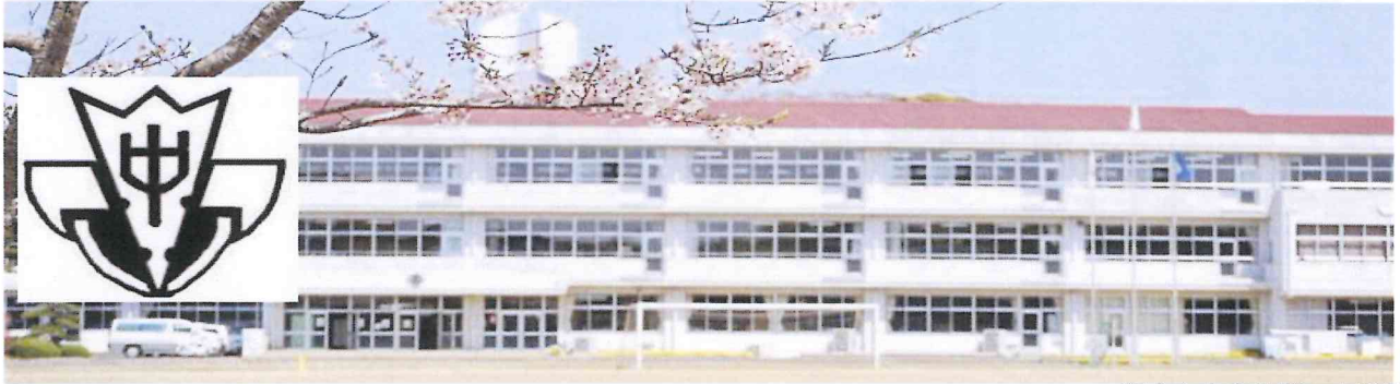
行方市立麻生第一中学校