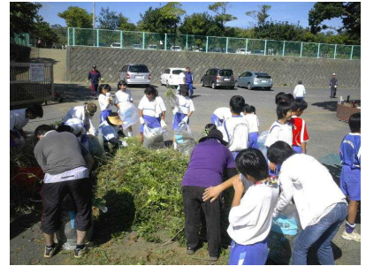
PTA奉仕活動(8/25) ご協力ありがとうございました。

保護者の皆様におかれましては、引き続き、ご理解とご協力をよろしくお願いいたします。