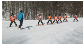
班別のスキーレッスン

1月17日(水)から3日間、福島県グランデコスキー場で1学年の大きな行事であるスキー宿泊学習が行われました。ほとんどの生徒はスキーの経験がなく、期待と不安が入り混じっていました。開校式後には、すぐにレッスン開始。1日目は雨交じりの天候の中で基本練習、2日目からは好天に恵まれ快調にレッスンが進みました。最終日には、多くの生徒が思い通りに滑ることができるようになりました。閉校式では、ほとんどの生徒がとても楽しかった、またスキーをしたいと答え、実行委員の代表がスキー教室の先生方にお礼を伝えました。