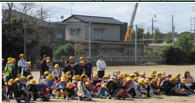
〈地区別一斉下校の様子〉

10月16日(水)には、地区別一斉下校をしながら、地区担当教員、地区委員の方々とともに「子どもを守る110番の家訪問」を実施しました。110番の家の場所を実際に確認したり、お礼の手紙を渡したりしました。地区委員の皆様、ご多用のところ誠にありがとうございました。