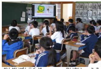
5年生全国歯みがき大会の様子