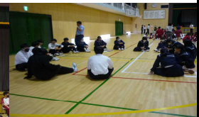
小中生徒指導主事